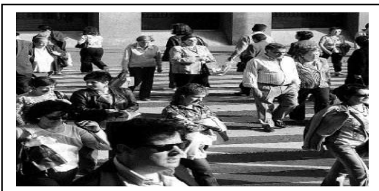
Bilbao, 2008.eko urtarrilaren 21a Langile Pastoraltzarako Idazkaritza

7.- Laikotasuna. Gaur egun Gobernuaren eta Elizearen arteko desadostasun eta txarto ulertuak dagoz eta, neurri haundi batean, bi arrazoirengaitik: alde batetik, laizismo oldarkor eta antiklerikalak bizirik dirauialako eta, bestetik, fededun giro batzuetan ez dakielako zelan kokatu gizarte demokratiko eta pluralista honetan. Gure eritziz, bizi dogun une honetan, erakunde biek jokoan dagozan jarrera guztiek parte hartuko daben gizarte eztabaidaren frutu dan laikotasun eredu baten alde egin behar dabe. Honen arabera, Estatuak uko egin beharko deutso ikuskera edo ideologia jakin bat presionatzeari edo ezartzeari 12 , eta, bestetik, Elizak ahalegina egin beharko dau, "bere egiazat dauanaren baieztapena gizarte demokratikoaren berariazko askatasunaren defentsagaz bateragarri egiteko, Estatuaren laikotasun 'sanoa' autortuz alkarte politikoan" 13 .