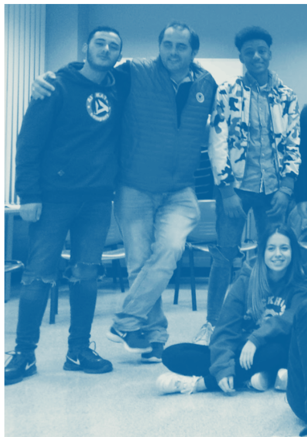
28 Foto de los participantes de Fronteras Invisibles 2016 en un encuentro posterior.